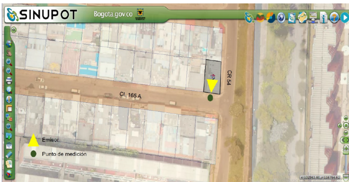
Figura 1. Ubicación del predio emisor y punto de medición.